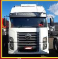
Cleomagna Cachoeira do Manteiga