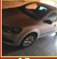
Guilherme Campo Belo