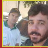
Engenharia e Consultoria Bambuí