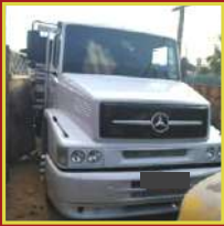
Célio Campo Belo