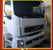
Gelson Campo Belo