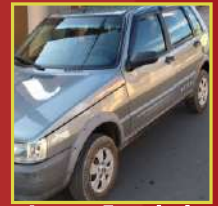
Impacto Engenharia Bambuí