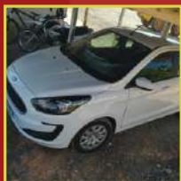
Edson Antônio Curvelo

Confira quem entrou para nossa família e vai poder contar com todos os serviços e vantagens!