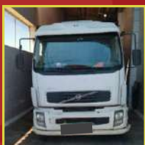
Thiago Campo Belo